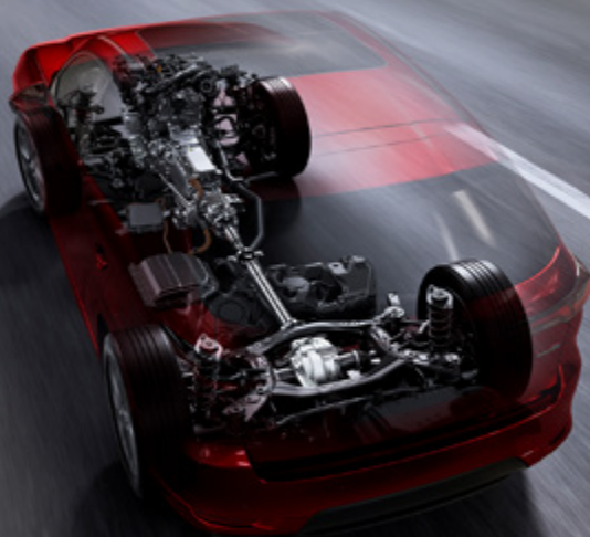
Mazda nutzt in seinem neuen CX-60 verschiedene Motoren.

Der neue 3,3 Liter e-Skyactiv D Dieselmotor verfügt über eine äusserst innovative und fortschrittliche Verbrennungstechnologie. Diese macht ihn mit einem Verbrauch von lediglich 5,0 l/100km und einem CO 2 -Ausstoss von lediglich 128 g/km zu einem der saubersten Dieselmotoren der Welt. Um sowohl Kraftstoff- als auch Energieeffizienz zu verbessern, hat Mazda die Grösse des Hubraums optimiert. Der neue, in Längsrichtung installierte Reihen-Sechszylinder-Motor e-Skyactiv D mit elektrischer Common-Rail-Direkteinspritzung und 3283 cm 3 Hubraum bietet eine Leistung von entweder 200 PS (Hinterradantrieb) oder 254 PS (Allradantrieb).