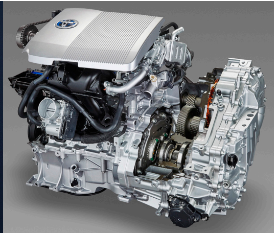
Einblick in den Hybridantrieb mit Verbrennungsmotor und zwei Elektromaschinen

Seit der Präsentation des Toyota Prius im Jahr 1997 gilt dieses Modell als Pionier der Hybridantriebstechnik. Als erstem Grossserienfahrzeug mit Hybridantrieb steht ihm also der aus dem Lateinischen stammende Name (prius, der Frühere) zu. Die ersten drei Modellgenerationen bilden die Basis für die aktuelle vierte Auflage, die sowohl als selbstladender Hybrid (HEV) wie auch als Plug-in-Hybrid (PHEV) angeboten wird.